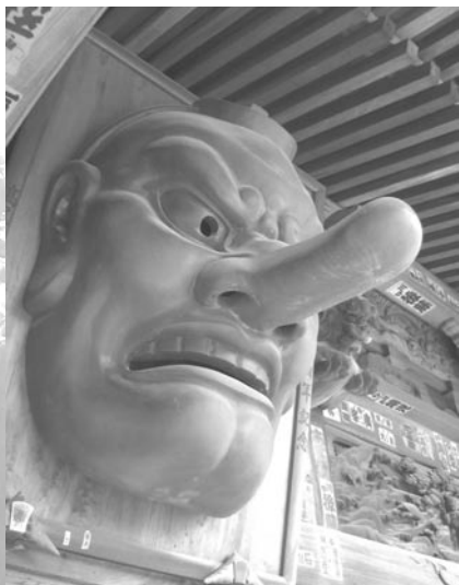
高尾山薬王院の天狗様