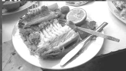
イラクの魚料理「マスグーフ」

■歩きやすい靴でお越しください。 ■高尾駅北口発小仏行きバス発車時刻 9時：12、32、52分 10時：12、32、52分